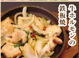
牛ホルモンの鉄板焼