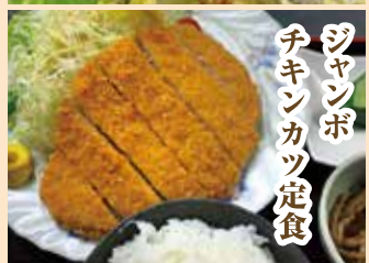
ジャンボチキンカツ定食