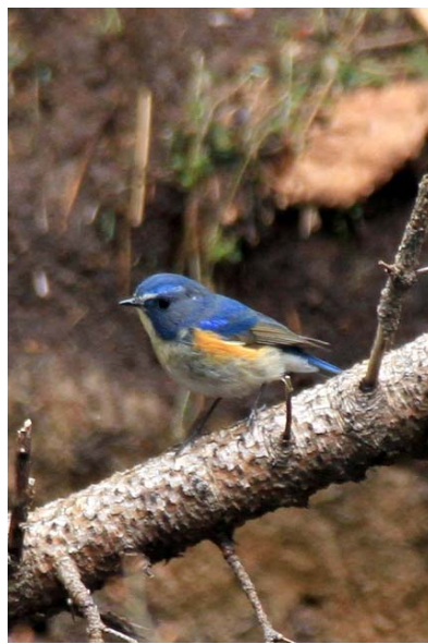
4/22 ルリビタキ(湯川沿い)