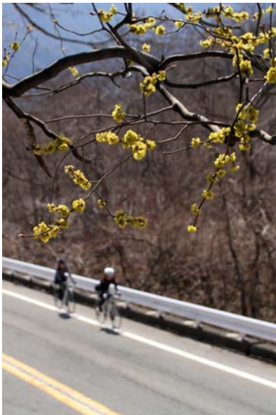
3/31 ダンコウバイ(馬返し)

※4/9~10 パシフィコ横浜で開催される mont-bell club フレンドフェアに出展。その為、次号は休刊の予定。