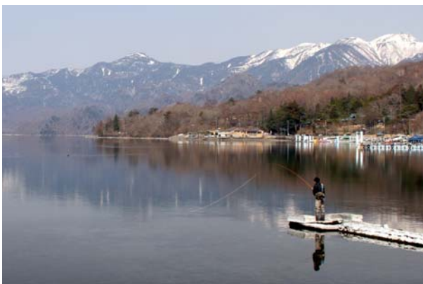
4/1 中禅寺湖 岸釣り解禁