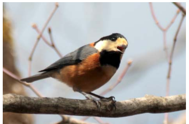
4/1 ヤマガラ(中禅寺湖畔)