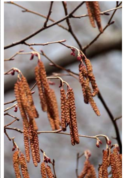
4/1 ケヤマハンノキ花(中禅寺)