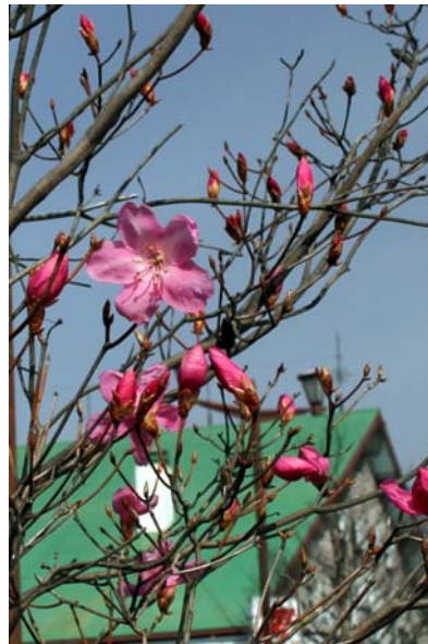
4/1 アカヤシオ開花(日光駅前)