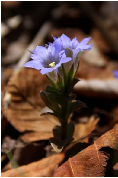
5/8 フデリンドウ(明智平)