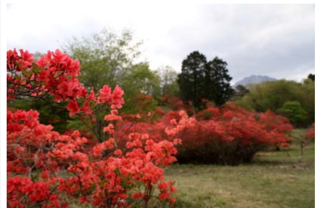
5/11 ヤマツツジ群落 (霧降高原)