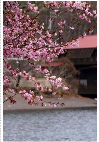
5/12 オオヤマザクラ(中禅寺湖)