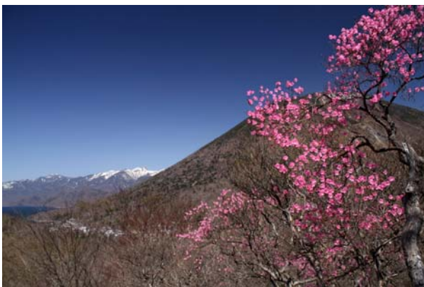
5/8 アカヤシオ(明智平付近)