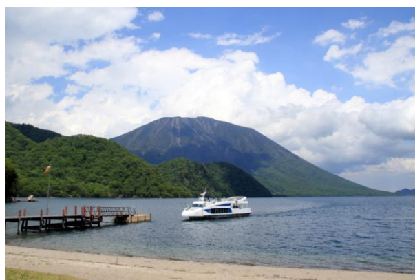
6/2 中禅寺湖機船 千手航路運行開始