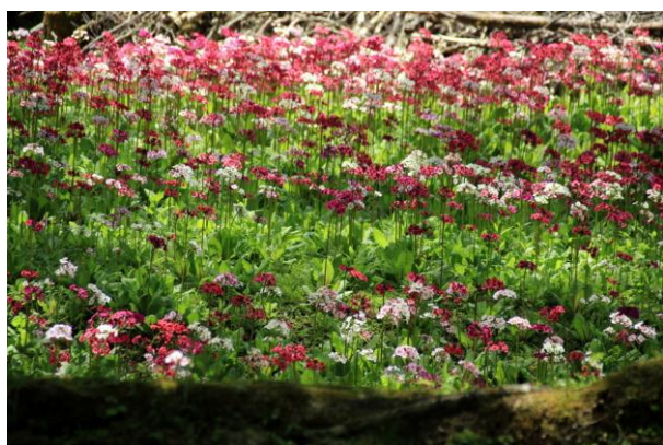
6/2 クリンソウ (千手ヶ浜民家)