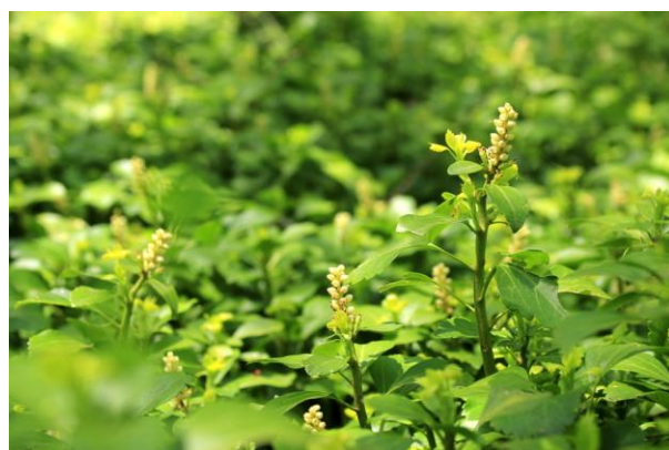
6/2 フッキソウ (千手ヶ浜)