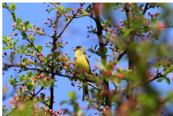
5/30 アオジ (戦場ヶ原)