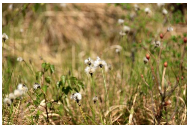
5/30 ワタスゲ (戦場ヶ原)