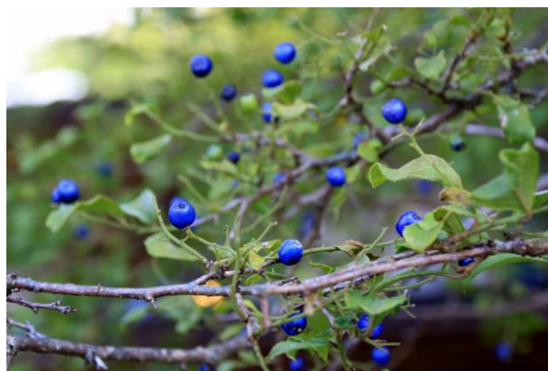
10/1 サワフタギ (伊大使館別荘前)