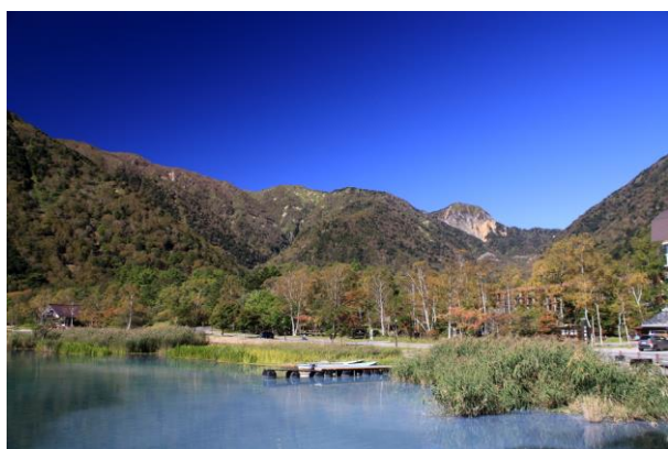
10/1 色づき進む (湯元)