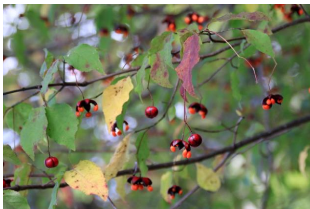
10/1 ツリバナ (伊大使館別荘前)