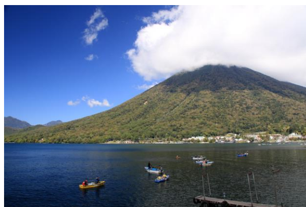
10/1 ワカサギ釣り (中禅寺湖)