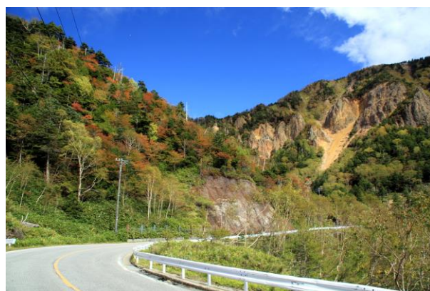
10/8 金精峠付近 紅葉五分