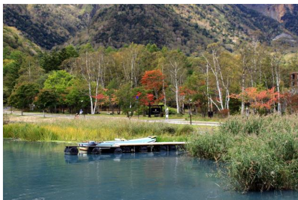
10/8 湯元温泉 紅葉五分