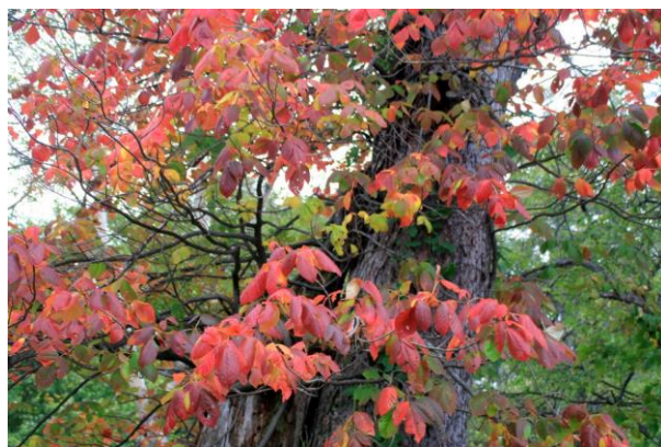
10/8 ツタウルシ (湯元)