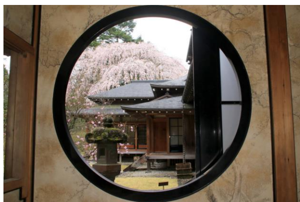
4/8 枝垂れ桜見頃 (田母沢御用邸)