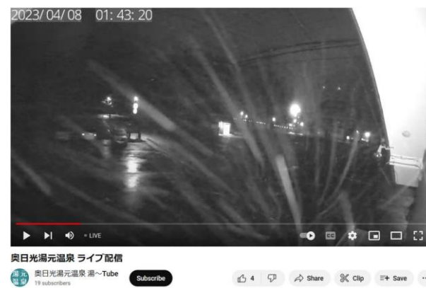
4/8 夜半、雪が舞う (湯元ライブカメラ)