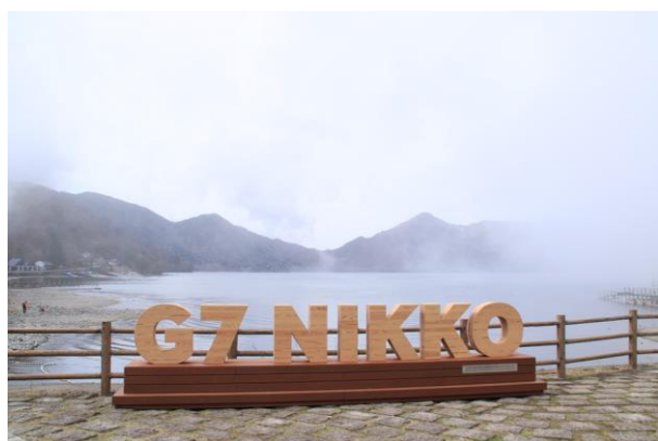
4/8 G7 NIKKO モニュメント(中禅寺湖畔)