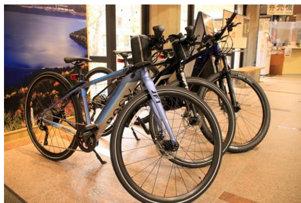
4/4 E-Bike (日光自然博物館)