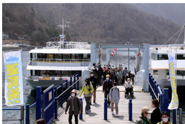
4/14 中禅寺湖遊覧船 運行再開