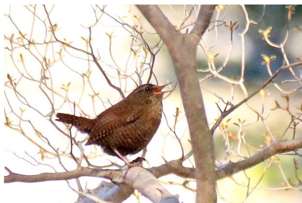
4/10 ミソサザイ囀る (湯ノ湖)