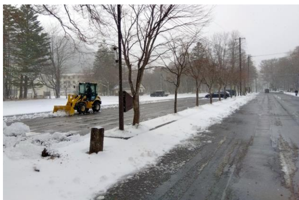
4/9 春の積雪 (湯元)