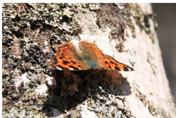
4/10 エルタテハ (湯ノ湖)