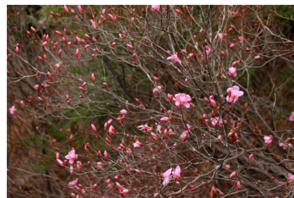
4/14 アカヤシオ開花 (中禅寺湖北岸)