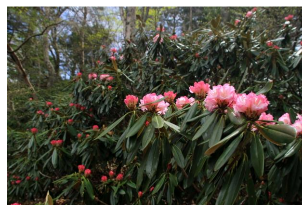
5/6 アズマシャクナゲ (湯ノ湖)