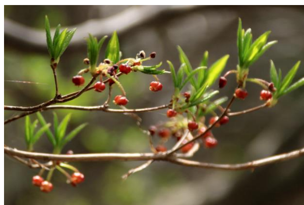
5/6 コヨウラクツツジ (湯ノ湖)