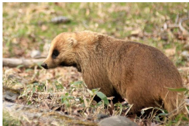
5/3 アナグマ (湯元地内)