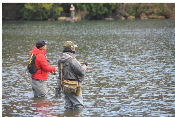
5/1 湯ノ湖・湯川釣り解禁 (@nikko_yumoto)