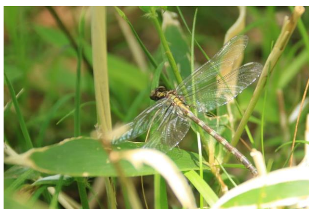
6/6 ダビドサナエ羽化 (湯ノ湖)