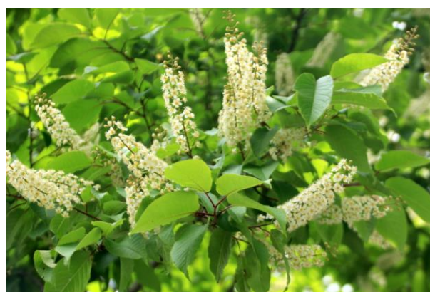
6/6 シウリザクラ (湯元)