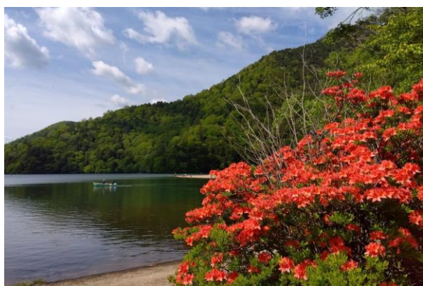
6/5 レンゲツツジ (湯ノ湖)