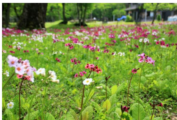
6/7 クリンソウ (千手ヶ浜民家)