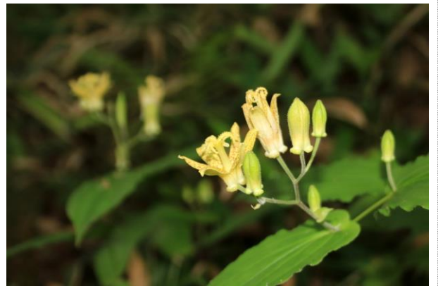
7/19 タマガワホトトギス (湯滝下)