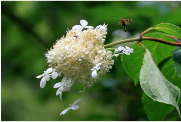
7/18 ノリウツギ (湯ノ湖)