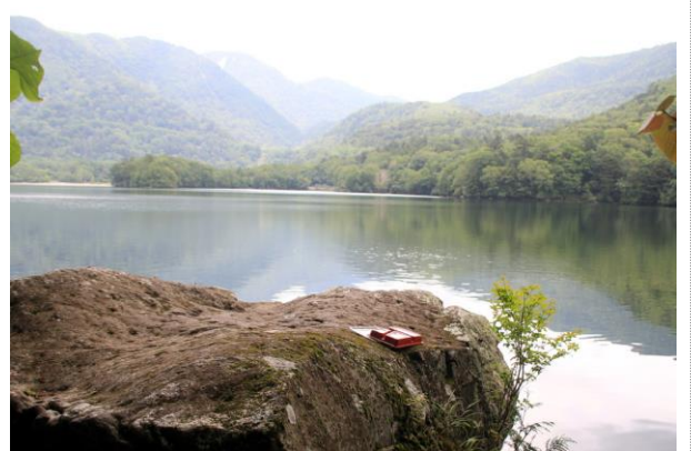
7/18 残置ゴミ (湯ノ湖)