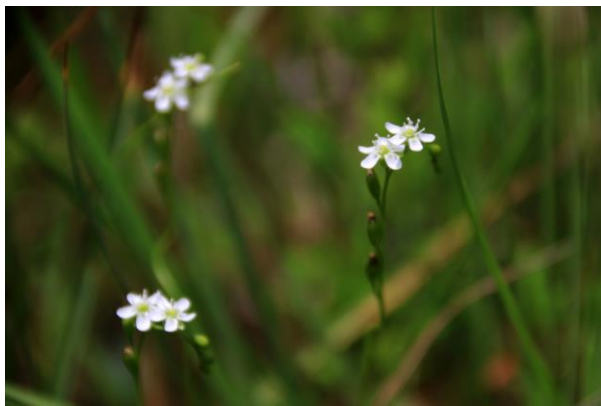
7/18 モウセンゴケ (兔島湿原)