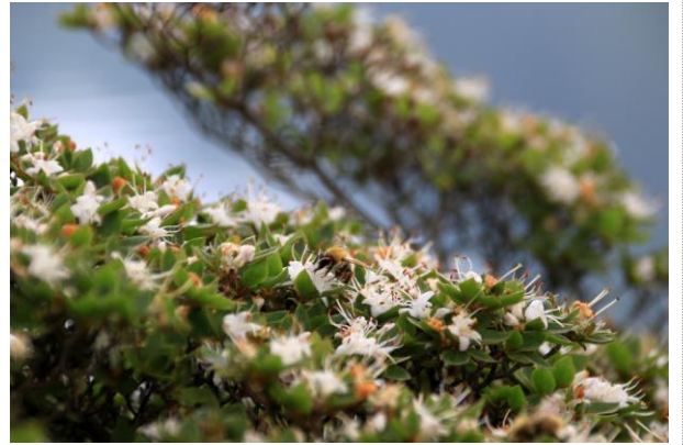
7/18 コメツツジ (湯ノ湖)