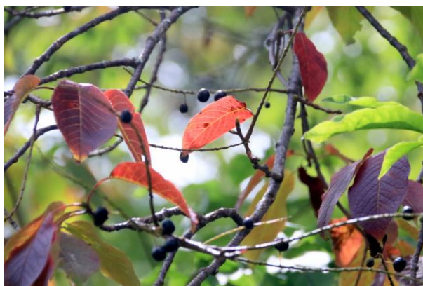
9/16 色づくシウリザクラ (湯元)