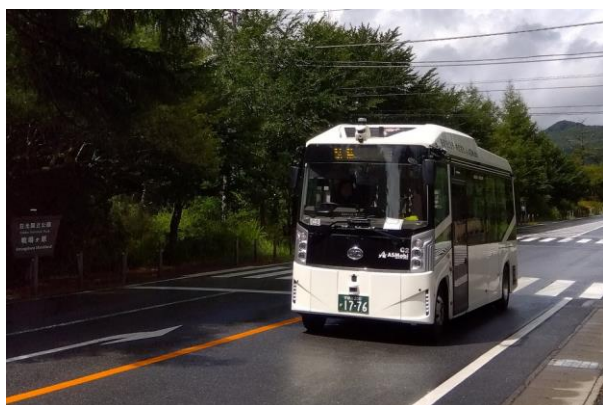
9/6 低公害バス自動運行車両