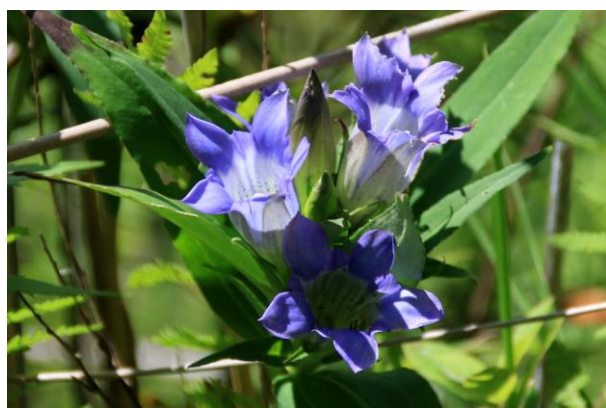
9/10 リンドウ (戦場ヶ原)