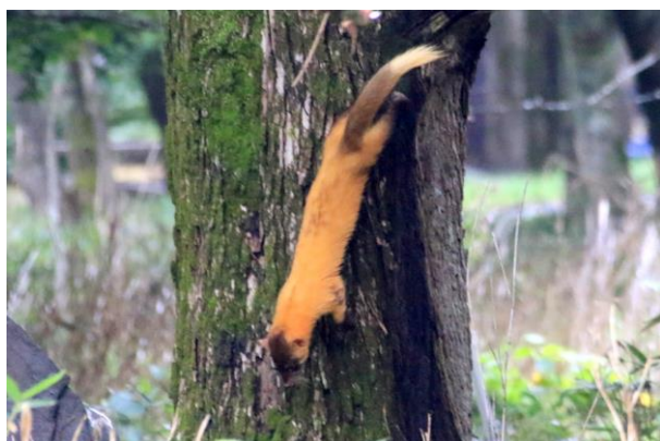
9/5 テン (湯元地内)