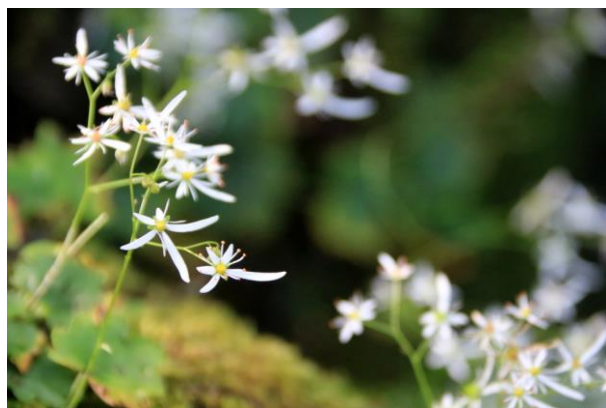
9/10 ダイモンジソウ (石楠花橋)