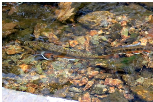
11/6 カワマス (湯滝下)