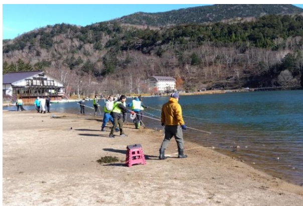
11/11 コカナダモ刈り (湯ノ湖)