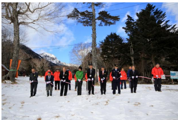
12/22 スキー場開き (湯元)