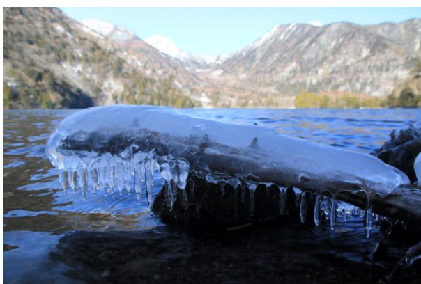
12/20 飛沫氷 (湯ノ湖)