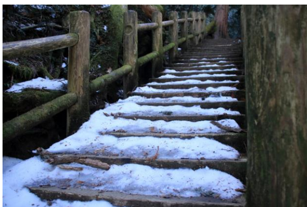
12/14 木段凍結 (刈込湖)