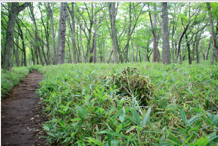
9/18 クマの食事痕 (戦場 泉門池北)