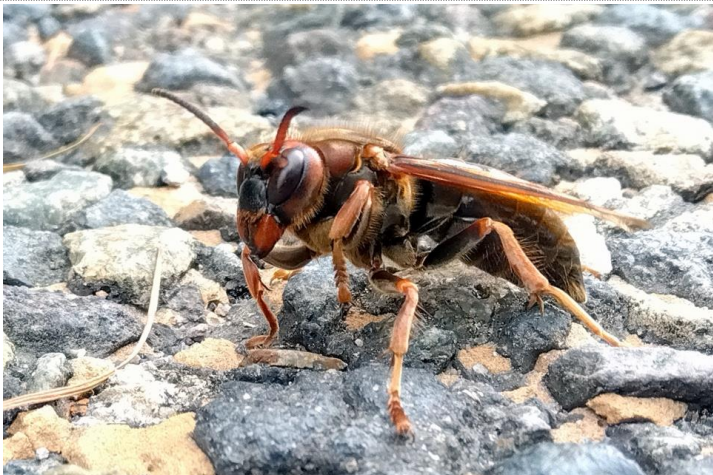
9/15 チャイロスズメバチ (湯元)