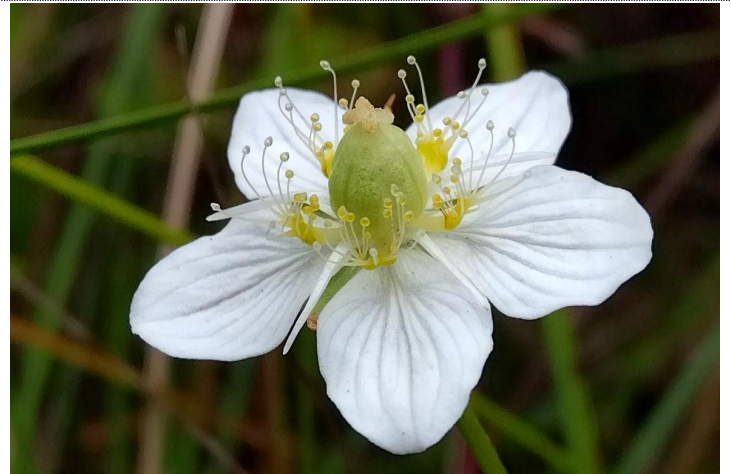
9/18 繊細な造形のウメバチソウ (戦場)