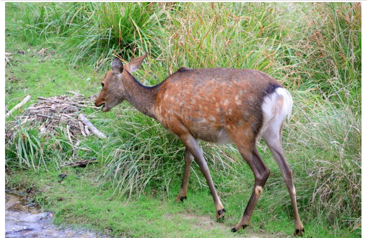
9/18 ニホンジカ背黒くなる (湯元)