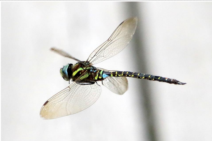
9/18 ルリボシヤンマ (北戦場)